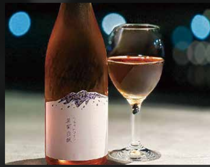
黒葡萄白醸 2023 (白) Glass ¥1,350- Bottle ¥7,900-