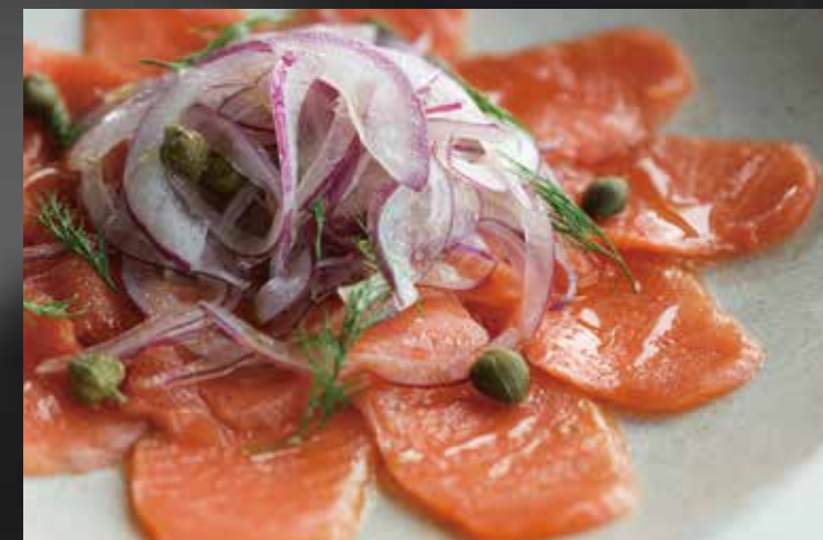
スモークサーモン デルの香り ¥1,800-