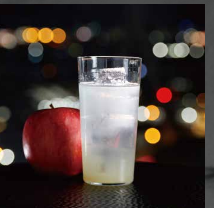
青森りんごの ブランデーハイボール ¥1,500-