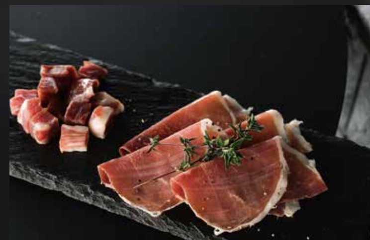
青森産 2年熟成生ハム ¥2,400-