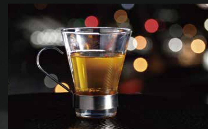
田酒ホットアップルティー りんご / 紅茶葉 / シナモン ¥2,000-