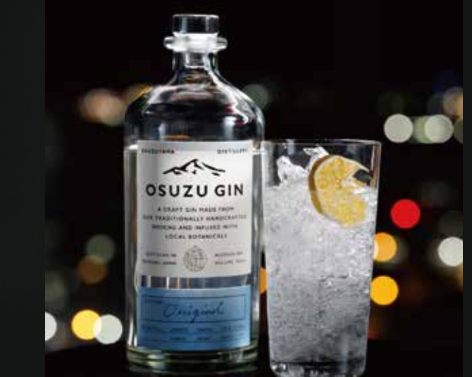
OSUZU GIN ¥1,300-