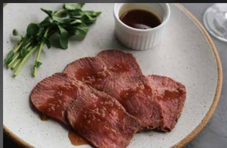
自家製ローストビーフ ¥2,800-