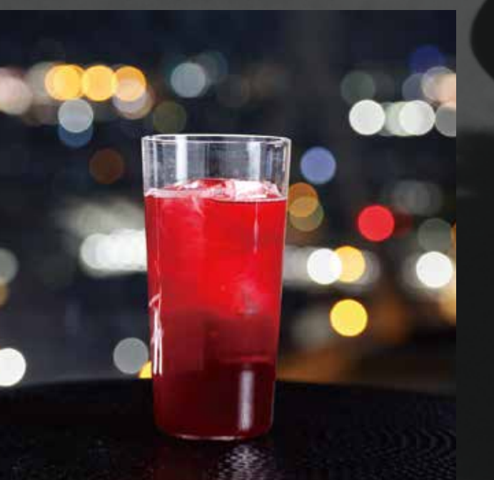
青森カシスを使った カシストニック ¥1,500-