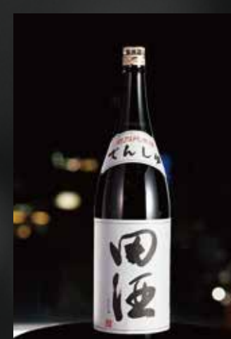
田酒 青森/西田酒造店 ¥900~