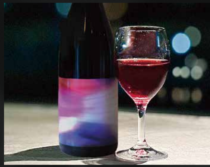
スチューベン 2022 (赤) Glass ¥1,600- Bottle ¥6,300-