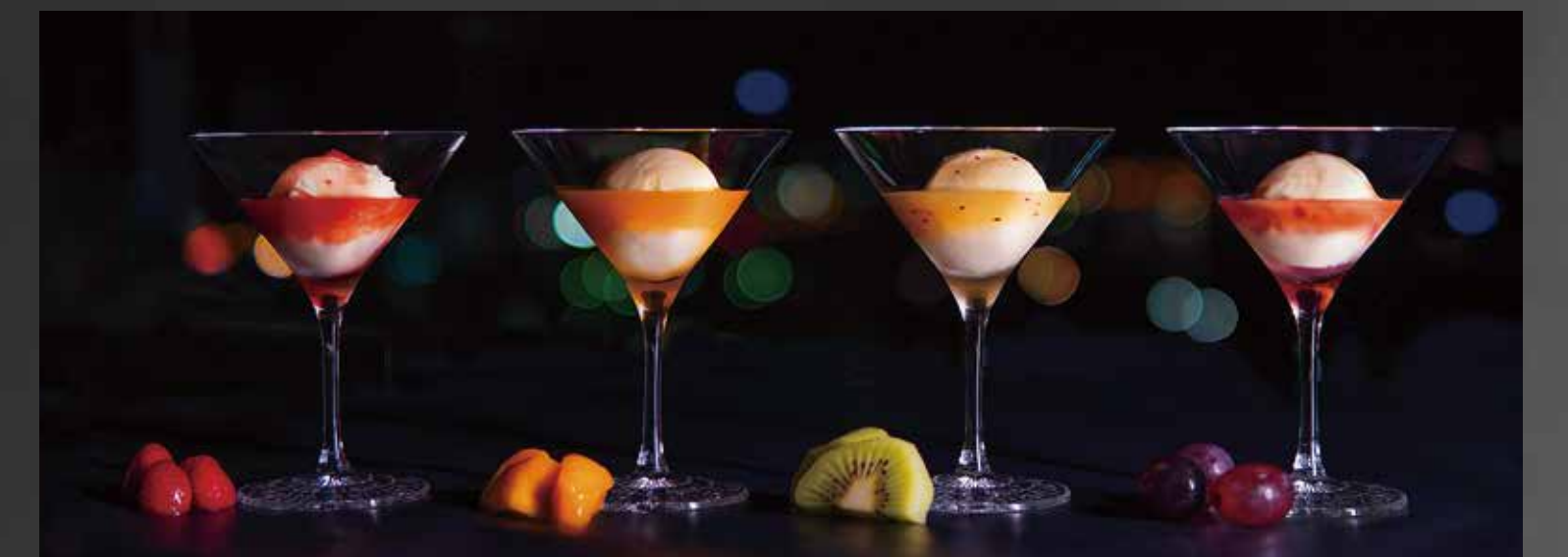
大人のバニラアイス ※アルコールが含まれている商品です。 ¥500-