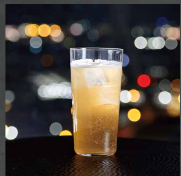
自家製クラフトコーラの コークハイ ¥1,500-