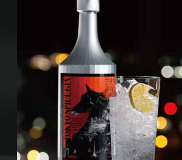
TOKYO SPICE GIN ¥1,300-