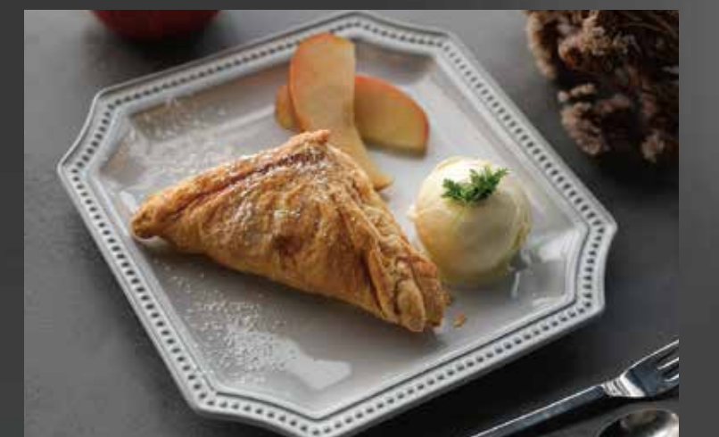
青森りんごのアップルパイ ¥1,300-