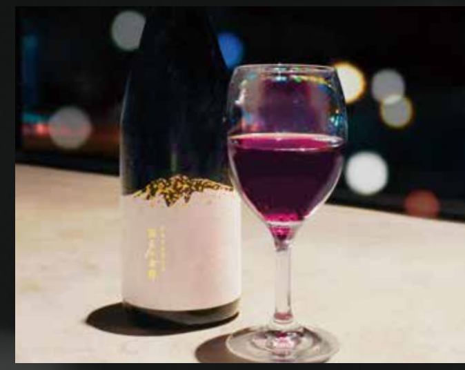
縄文の奇跡 2023 (赤) Bottle ¥11,000-