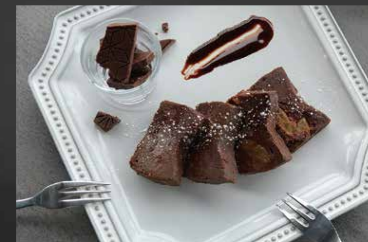
恋するカカオ チョコレートプレート ¥2,550-