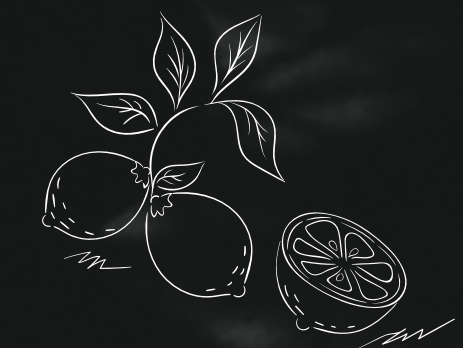
アールグレイレモンサワー ¥1,000-