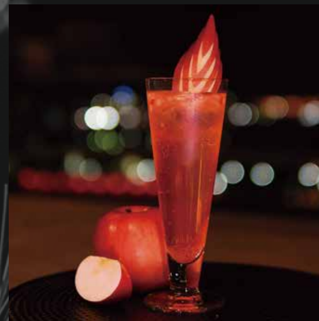
青森りんごの パッサア・トニック ¥1,500-