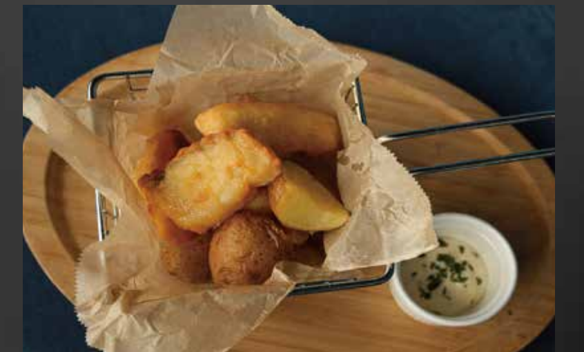
フィッシュ&チップス ¥1,400-