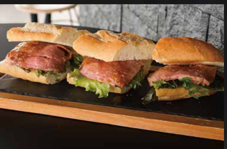
ローストビーフサンド ¥2,600-