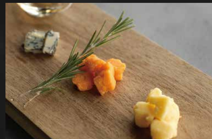
チーズ盛り合わせ ¥2,400-