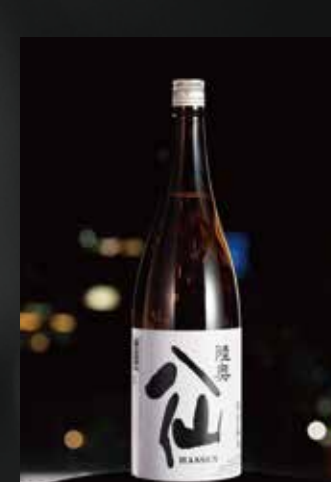
陸奥八仙 八戸/八戸酒造 ¥900~