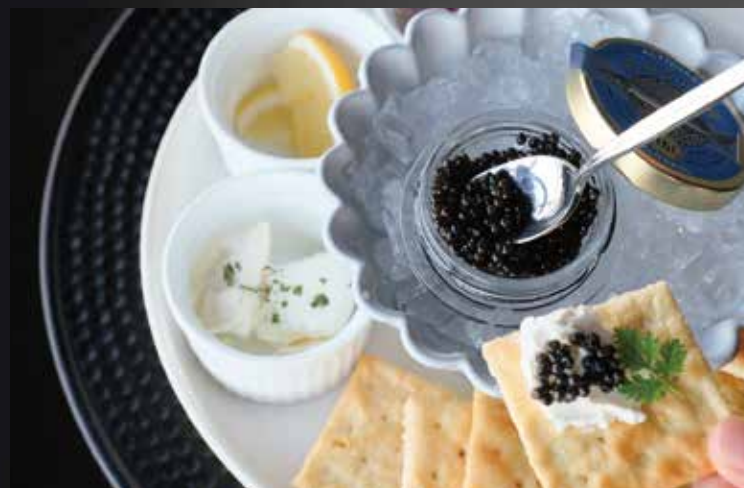
キャビアフラッペ ¥16,500-