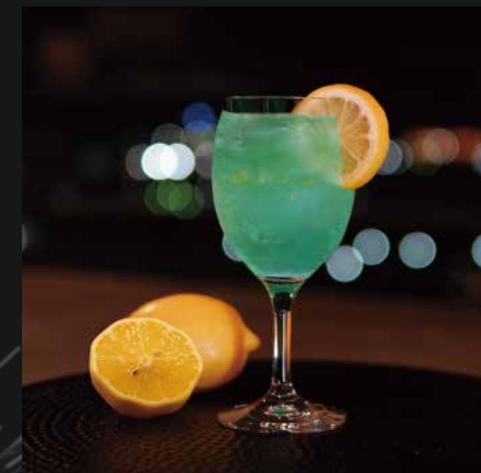
レモン・チャイナブルー ¥1,500-