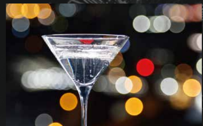
豊盃ボール アップルブランデー / レモン ¥2,000-