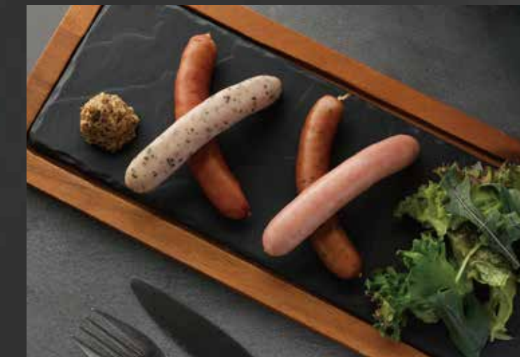
北海道産4種のソーセージ ¥1,600-