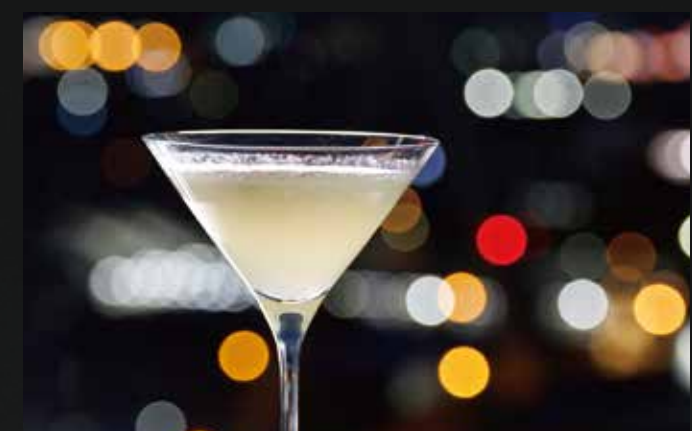
八仙フローズンカクテル りんごのフローズン / カルダモン ¥2,000-