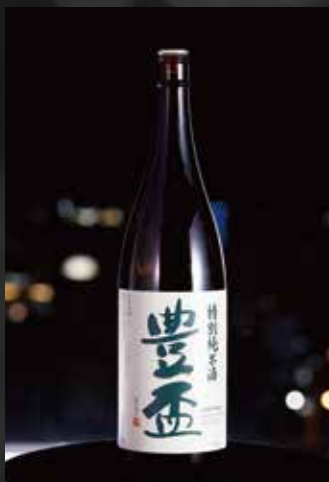
豊盃 弘前/三浦酒造 ¥900~